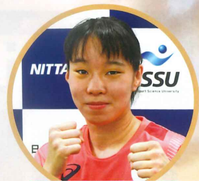
大会アンバサダー 日本体育大学在学学生オリンピック 入江聖奈選手 (ボクシング)